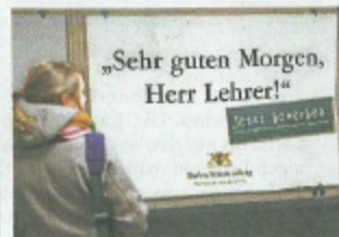
Ganz freundlich wirbt Baden-Württemberg um neue Lehrer.

Wößmann hat erstmals die Noten der Lehrer mit denen anderer Berufs-